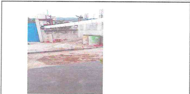
Foto1: Salida de agua pluvial